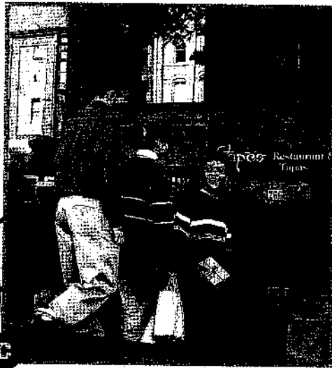
C Durante el año escolar, puedes comer con los amigos.